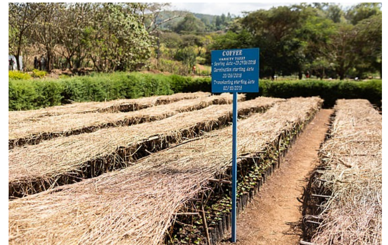
Trocknungsbetten für Kaffee