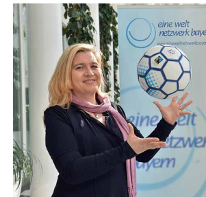
Staatsministerin Melanie Huml mit fairen Bällen aus Bayern

Von der Qualität sind sie Bällen aus dem konventionellen Handel ebenbürtig. In den Fairhandels-Standards sind bessere Arbeitsbedingungen für die Menschen in den Ballfabriken vorgeschrieben. Hierzu gehören u.a. der Ausschluss von Diskriminierung am Arbeitsplatz und das Verbot von Kinderarbeit.