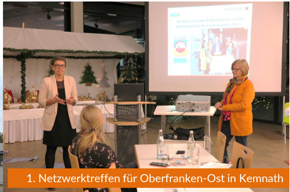
1. Netzwerktreffen für Oberfranken-Ost in Kemnath