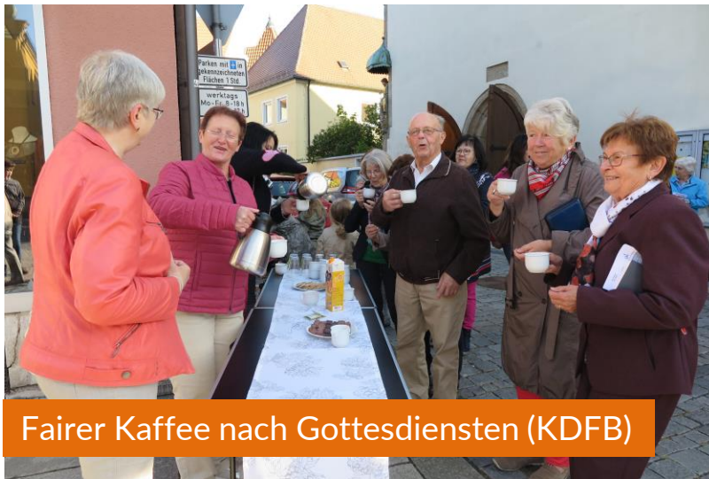
Fairer Kaffee nach Gottesdiensten (KDFB)