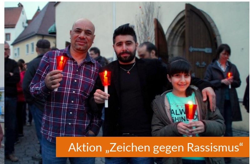
Aktion „Zeichen gegen Rassismus“