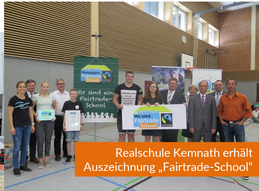
Realschule Kemnath erhält Auszeichnung „Fairtrade-School“