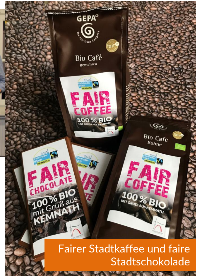
Fairer Stadtkaffee und faire Stadtschokolade