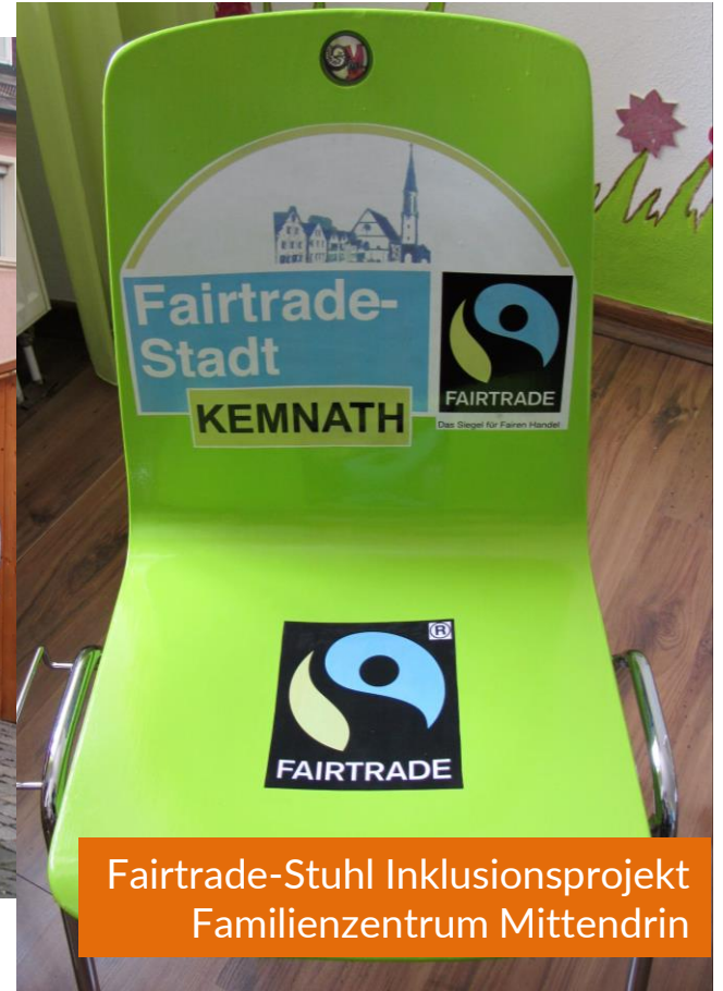
Fairtrade-Stuhl Inklusionsprojekt Familienzentrum Mittendrin