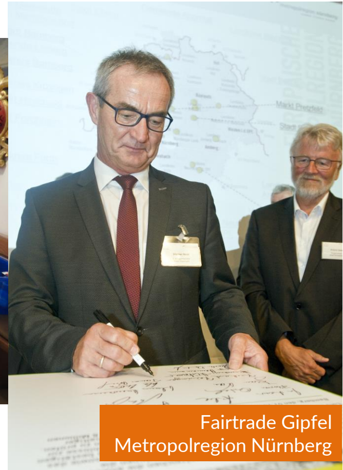
Fairtrade Gipfel Metropolregion Nürnberg