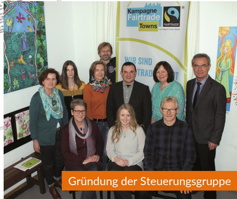
Gründung der Steuerungsgruppe