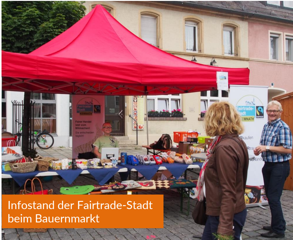
Infostand der Fairtrade-Stadt beim Bauernmarkt