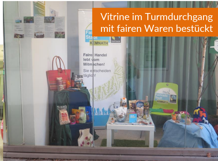
Vitrine im Turmdurchgang mit fairen Waren bestückt