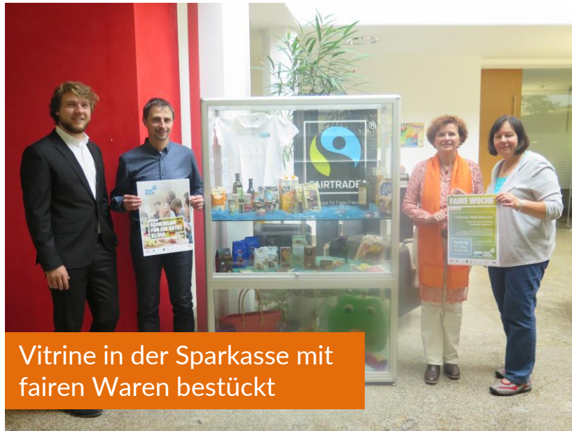
Vitrine in der Sparkasse mit fairen Waren bestückt