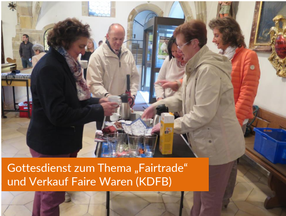
Gottesdienst zum Thema „Fairtrade“ und Verkauf Faire Waren (KDFB)