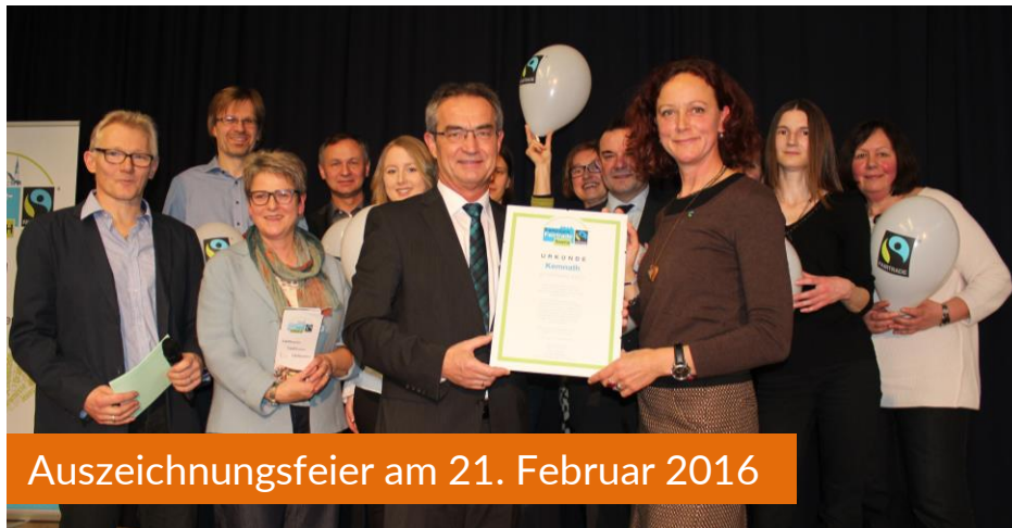
Auszeichnungsfeier am 21. Februar 2016