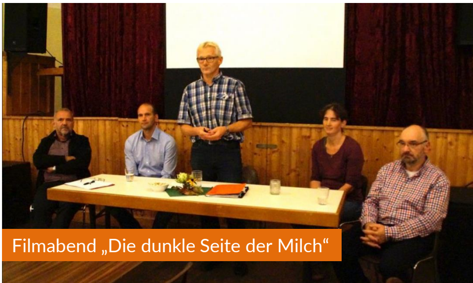
Filmabend „Die dunkle Seite der Milch“