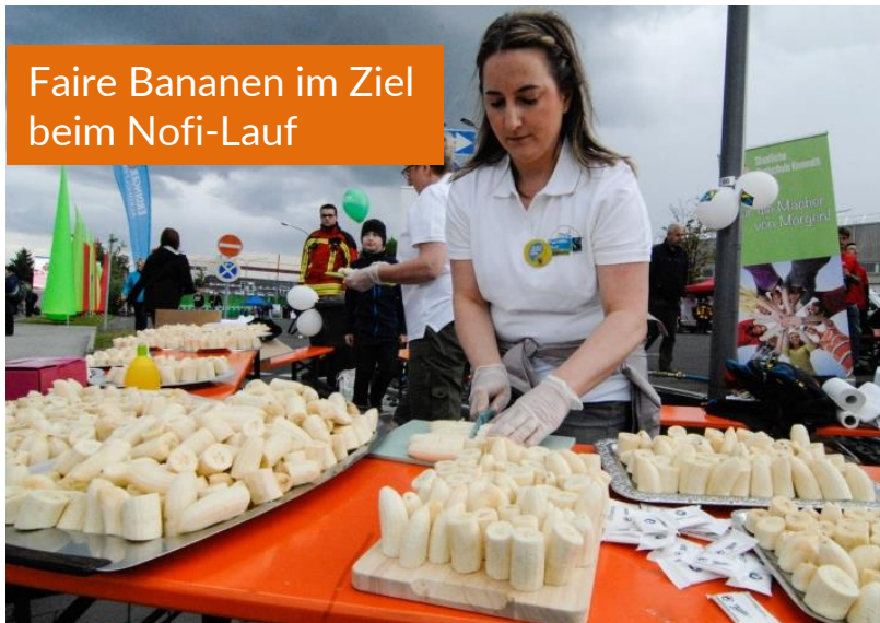
Faire Bananen im Ziel beim Nofi-Lauf