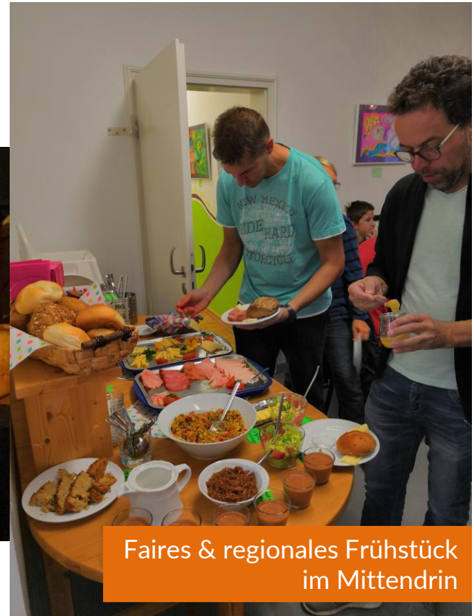
Faires & regionales Frühstück im Mittendrin