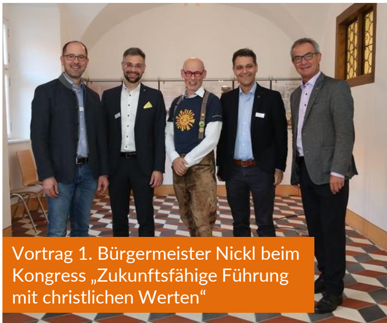
Vortrag 1. Bürgermeister Nickl beim Kongress „Zukunftsfähige Führung mit christlichen Werten“