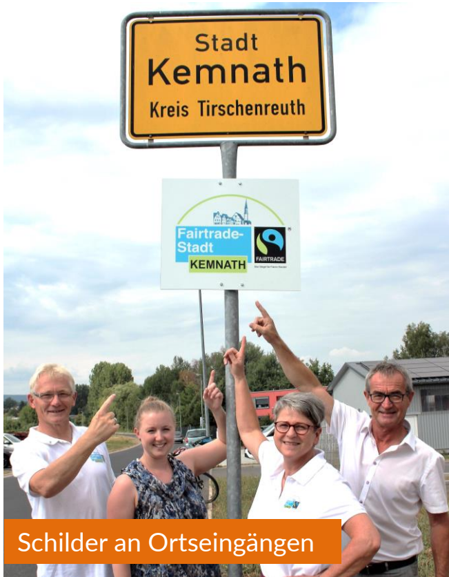
Schilder an Ortseingängen