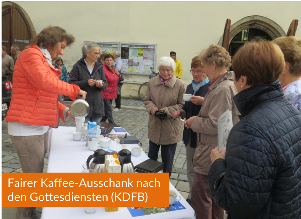
Fairer Kaffee-Ausschank nach den Gottesdiensten (KDFB)